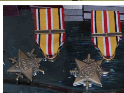
Gwiazdy Iraku i Afganistanu