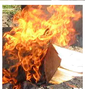
Czad cichy zabójca