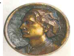
A Kali ski

Ksi ka zyskała wiele pochlebnych recenzji i stanowi ciekaw form promocji wiedzy o muzyce.