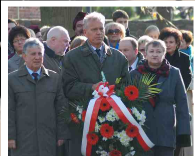
wi to Niepodległo ci