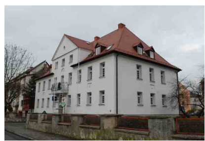
Remont siedziby starostwa

Termomodernizacja budynku Internatu Zespołu Szkół nr 1 w Choszcznie