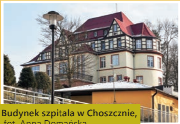
Budynek szpitala w Choszcznie, fot. Anna Domańska

► Stradzewo: zespół pałacowy z połowy XIX w., pałac i park z alejami dojazdowymi, dawna stajnia i dawny gołębnik z końca XIX w.