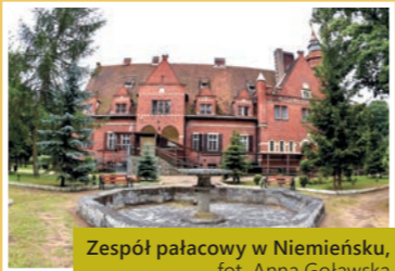
Zespół pałacowy w Niemiensku

► Wąrdyń: zespół dworski z XVIII-XIX w. – ruina dworu z XVI-XIX w. oraz park.