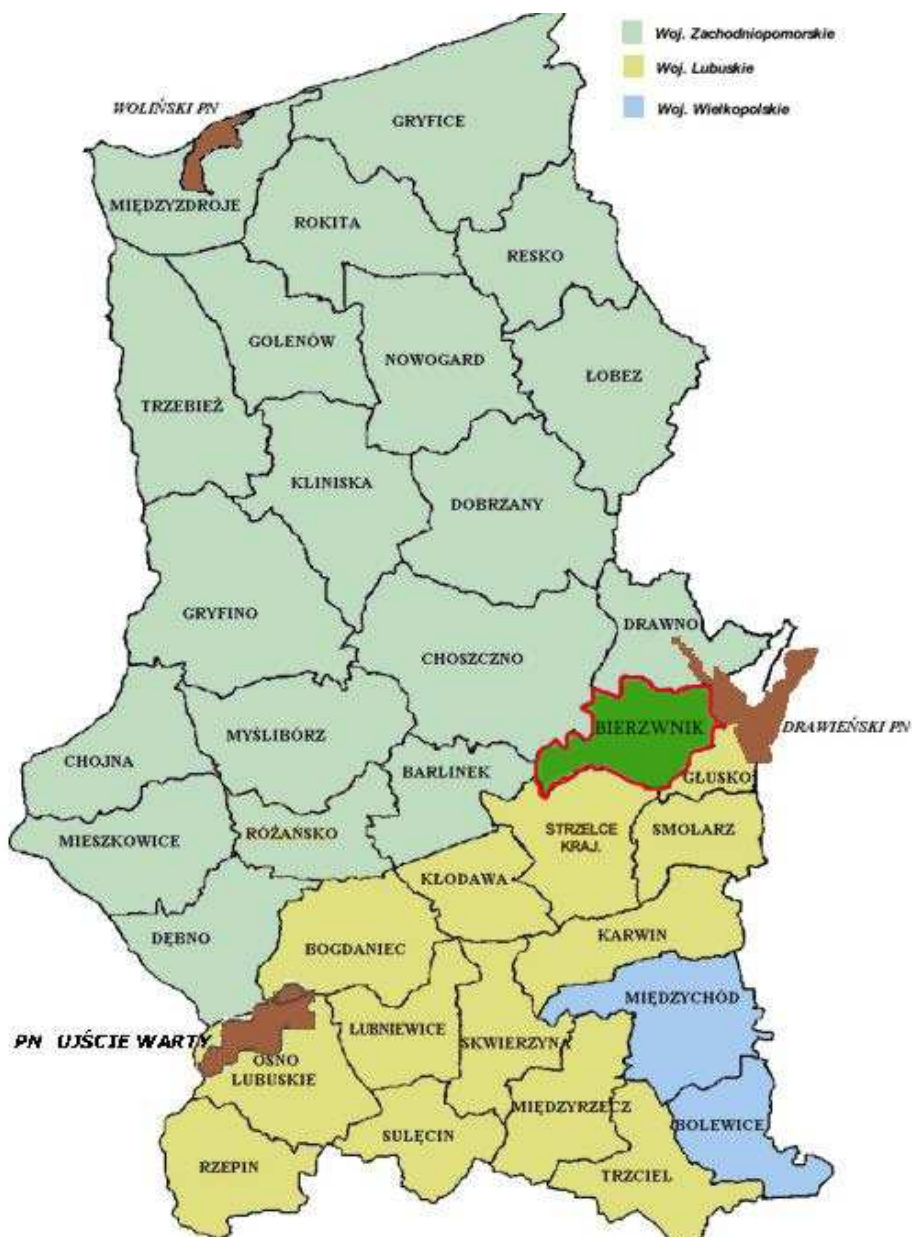
Rys. 1. Położenie gminy Bierzwnik

Gmina Bierzwnik leży w południowej części powiatu choszczeńskiego, położonego w województwie zachodniopomorskim. Od północnego zachodu graniczy z gminą Choszczno (woj. zachodniopomorskie), od północnego wschodu z gminą Drawno (woj. zachodniopomorskie), od południa z gminami Dobiegniew i Strzelce Krajeńskie (woj. lubuskie) a od zachodu z gminą Krzęcin (woj. zachodniopomorskie).