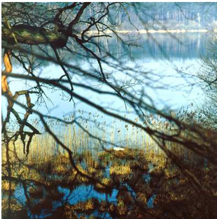
Fot. 2. Jezioro Ostrowiec