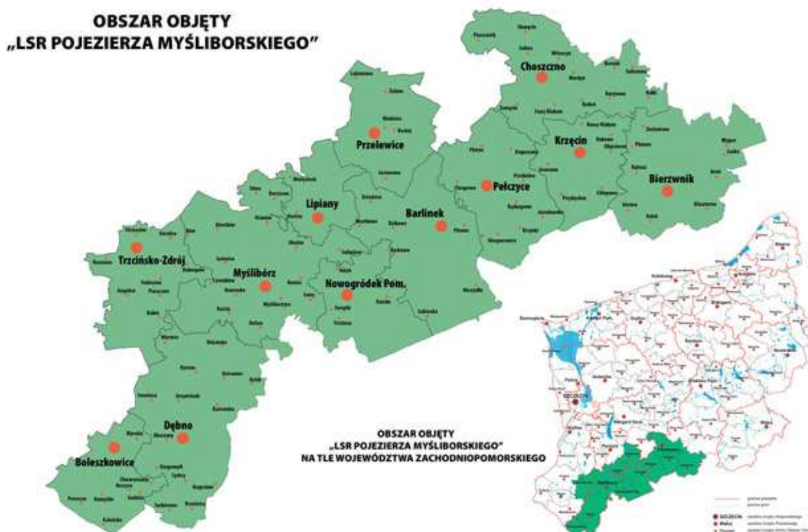
Rys. 4. Obszar działania Stowarzyszenia „Lider Pojezierza”

Głównym celem działania LGD jest rozwój terenów wiejskich zgodnie z zasadami Inicjatywy Wspólnotowej LEADER. Hasłem przewodnim jest „WODA-DRZEWO-MYŚL-słowa, które jednoczą”. Obszar działania Stowarzyszenia to teren przede wszystkim lesisty i obfitujący w jeziora. Średnio 30% obszaru porośnięte jest pięknym i zróżnicowanym lasem, w trzech