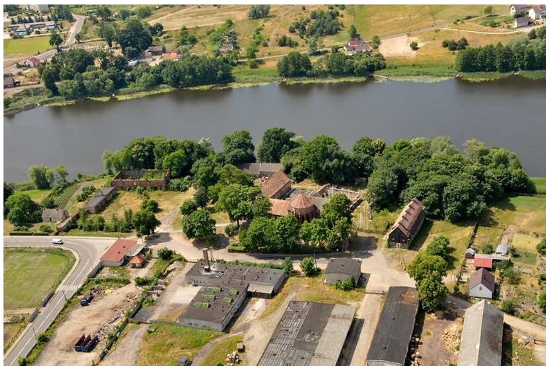
Fot. 1. Panorama z widokiem na jezioro Kuchta i klasztor pocysterski

Na terenie gminy występuje 41 jezior, a kolejne 3 leżą przy granicach z gminami ościennymi. Występują tu 2 duże jeziora o powierzchni przekraczającej 100 ha, 9 jezior średnich (25-100 ha), 19 małych (6-25 ha), 9 bardzo małych (2-6 ha) i 2 jeziorka (1-2 ha). Przeważająca większość jezior gminy jest pochodzenia polodowcowego i zajmuje dna rynien glacialnych oraz obniżenia wytopiskowe.